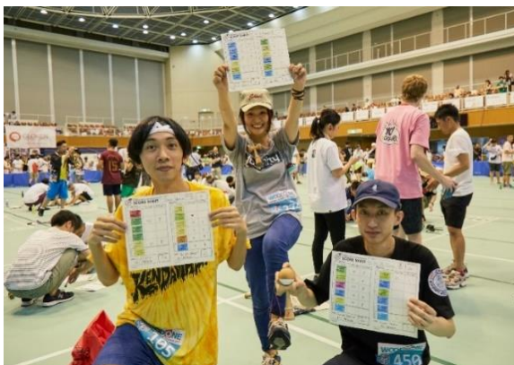
ご自身で、挑戦するトリックを選択