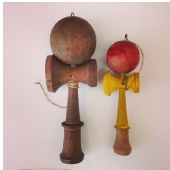
日月ボール（大正～昭和初期の形状）