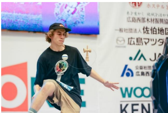
制限時間内（3分）で挑戦