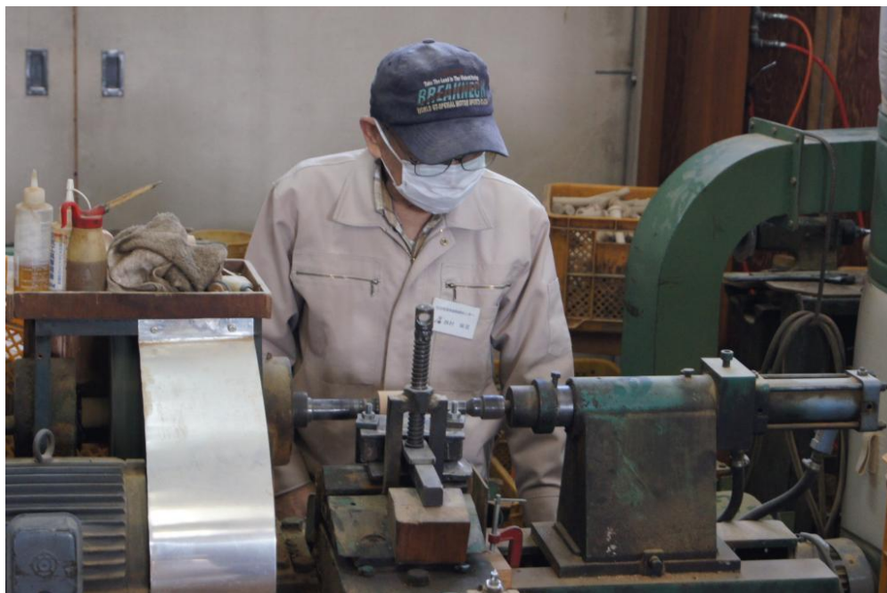
廿日市市でのけん玉製造の様子（木材利用センター）

2021年には、製造開始から100周年の節目となります。けん玉ワールドカップ廿日市開催時には、全国、そして世界中のけん玉ファンを廿日市にて迎えたいと考えています。