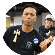
South kendama (Taiwan) 代表 甲鳥豆頁 (Duck) ダック